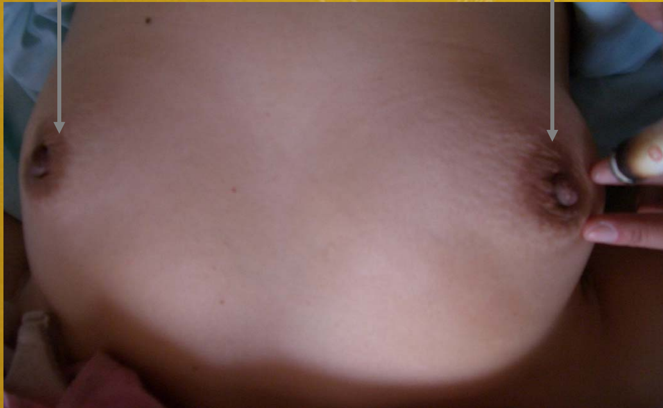
正在进行悬灸时的乳房